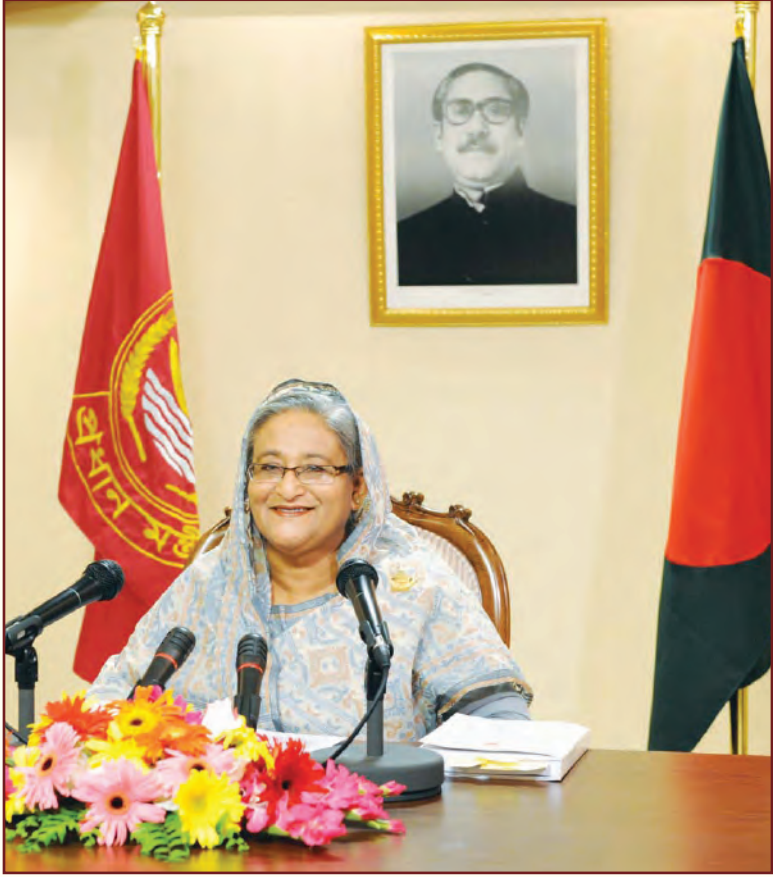
গণপ্রজাতন্ত্রী বাংলাদেশ সরকারের মাননীয় প্রধানমন্ত্রী শেখ হাসিনা